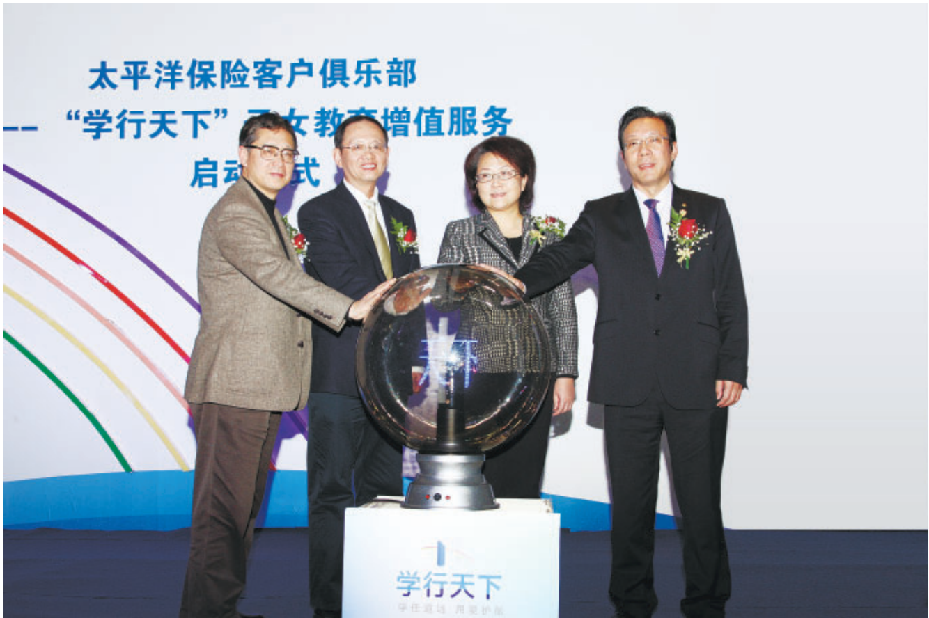
太保壽險推出“學行天下”子女教育增值服務